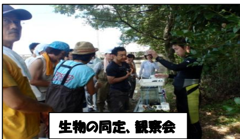
生物の同定、観察会