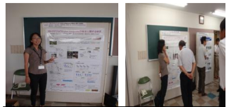
ホトケドジョウの保全に関する研究